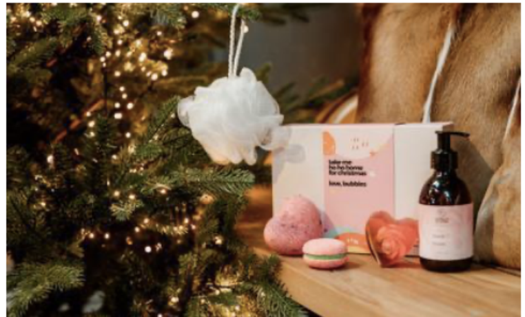
Foto Bubbles at Home