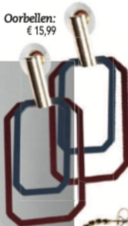
Oorbellen: € 15,99