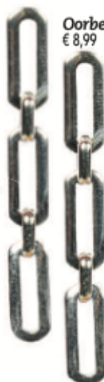
Oorbellen: € 8,99